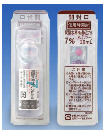
炭酸水素 Na 静注 7%PL 「フソー」